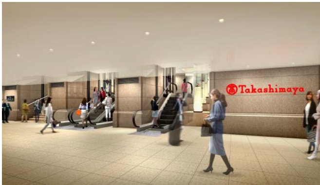
(地下区道・本館百貨店側イメージ)