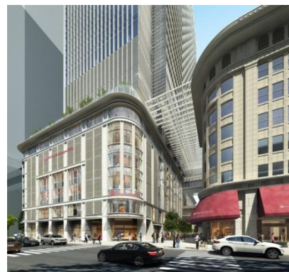
(日本橋高島屋 S.C.外観 イメージ 中央通り側ファサード)

新館、東館、ガレリア専門店（本館側面）からなる、新設の専門店エリアは、お客様からも高い支持を得る「玉川高島屋 S・C」などの実績を持つグループ会社東神開発株式会社がテナントリーシング及び管理運営することで、従来の百貨店に新しい魅力を付加した商業施設を構築いたします。