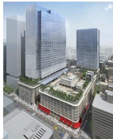
(日本橋高島屋 S.C.外観 イメージ俯瞰図)

同事業は当社グループが推進する「まちづくり戦略」を象徴する事業であり、高島屋日本橋店に隣接して専門店エリアを新設・増床し、東京の中心に百貨店を核とした、約66,000㎡の新・都市型ショッピングセンター「日本橋高島屋 S.C.」が誕生します。