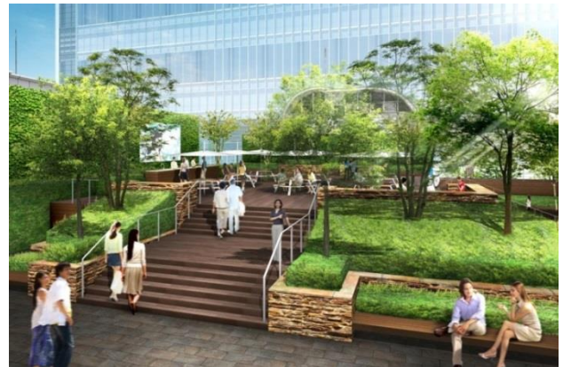
(屋上庭園 イメージ)

本館屋上と新館・東館の基壇部屋上を合わせ、約6,000㎡の都内では最大級となる屋上庭園「日本橋グリーンテラス」を設置します。ご来店のお客様のみならず、ビル高層部オフィスのワーカーや、周辺の住民の方々にもご利用いただけるオープンスペースとし、様々なイベントも実施し、日本橋地区の賑わいに寄与します。