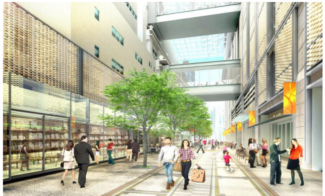
(日本橋ギャラリー（仮称）イメージ)

本館と新館の間にある区道284号線は地域のにぎわい核の創出に向けた取り組みとして都市計画により歩行者専用道路となります。道路上空には地域の象徴にもなる「大屋根」が設置され、ギャラリー空間が誕生します。区道沿線を路面店舗化して界限性を高めます。