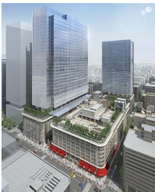
(日本橋高島屋S.C. 外観 イメージ俯瞰図)

高島屋は日本橋二丁目地区市街地再開発組合の一員として、当社グループが推進する「まちづくり戦略」を象徴する「日本橋二丁目地区第一種市街地再開発事業」を推進しています。高島屋日本橋店(本館)に隣接した専門店エリアとなる「東館(2018年春開業予定)」「新館(2018年秋開業予定)」を新設・増床、「タカシマヤウオッチメゾン」を合わせ4館構成の百貨店を核とした、約66,000㎡の新・都市型ショッピングセンター「日本橋高島屋S.C.」が2018年秋誕生します。