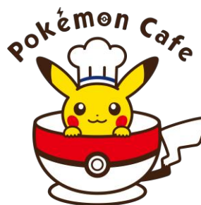
(右) ポケモンカフェ ロゴ