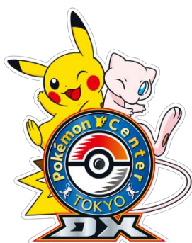
(左) ポケモンセンタートウキョーDX ロゴ

ポケモンセンター創業の地 東京・日本橋に、初のカフェ併設ショップ ショッピングと飲食を楽しめるダイナミックな空間誕生