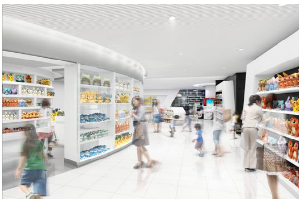
(左) ポケモンセンタートウキョーDX 店内イメージ

※ 周辺道路・駐車場は大変混雑が予想される為、ご来店の際は公共交通機関をご利用ください。