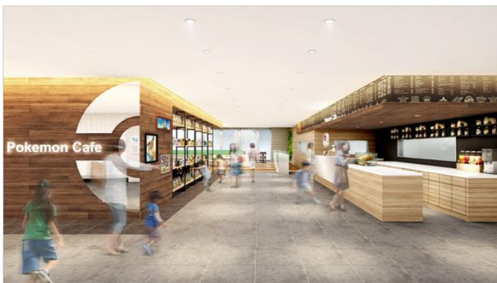
(右) ポケモンカフェ 店内イメージ