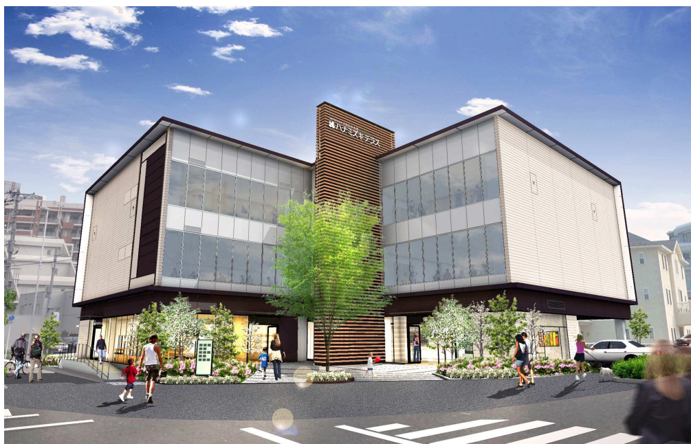
「NAGAREYAMA おおたかの森GARDENS ハナミズキテラス」イメージ