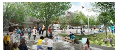
駅前広場イメージ