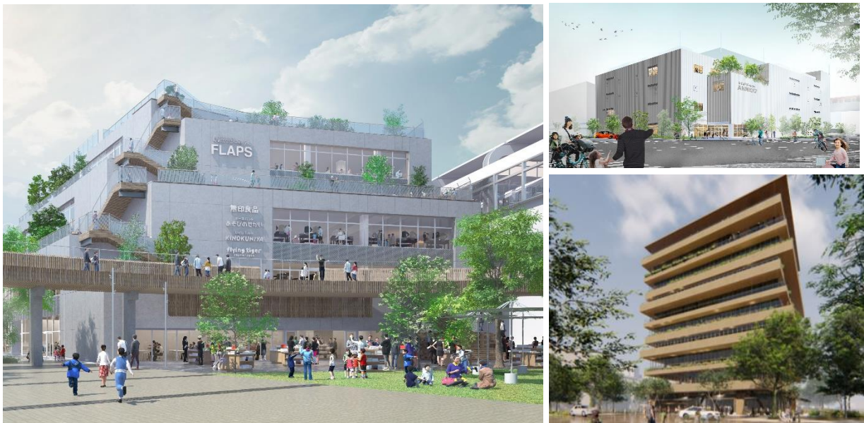
左:『流山おおたかの森 S・C FLAPS』(A3街区)、右上:『流山おおたかの森 S・C ANNEX2』(B43街区) 右下:『NAGAREYAMA おおたかの森 GARDENS アゼリアテラス』(B45街区)

※街区名は、流山市の都市計画事業「新市街地地区一体型特定土地区画整備事業」によるものです。