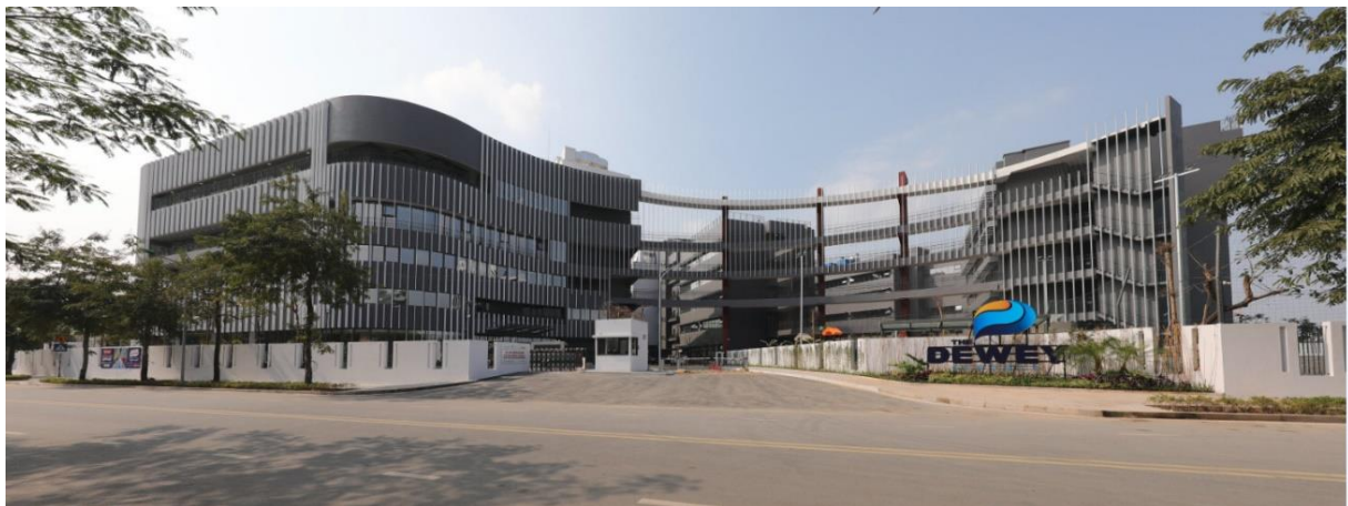
「THE DEWEY SCHOOLS」外観

今後もエデュフィット社とのアライアンスを強化し、ベトナムの成長産業である教育関連施設の開発に対し積極的に投資を行ってまいります。