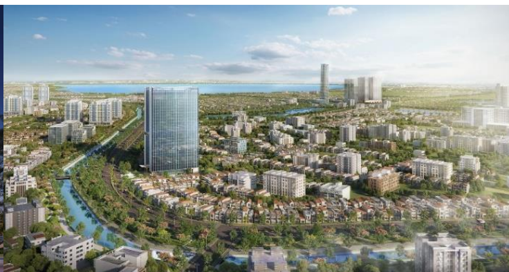
ランカスター・ルミネール周辺エリア(イメージ)

東神開発は本プロジェクトを、TTG 社との共同出資により展開します。まず事業を二つのフェーズに分け、最初の住宅分譲期間はTTG 社がマジョリティをとり、その後のオフィス・商業の賃貸事業期間は、東神開発が出資比率を上げてマジョリティをとります。分譲住宅・オフィス・商業事業の複合開発のうちTTG 社は分譲住宅事業で強みを発揮し、東神開発はオフィスおよび商業の賃貸事業において強みを発揮することで、質の高い施設開発を実現します。