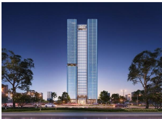
ランカスター・ルミネール外観(イメージ)

今回のプロジェクトは、住宅・オフィス・商業から成る複合開発で、東に都心部「バディン区」、西に新都心「カウザイ区」との結節点となるエリアに位置し、交通アクセスも良いことから、今後外資系企業の進出などビジネス・商業エリアとしての発展が期待されている地域にあります。