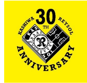
柏レイソル30周年記念ロゴ