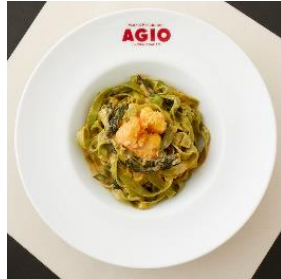
アジオ (S 館専門店 7F)