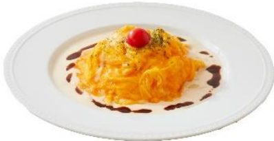
イデカフェ (新館専門店 10F)