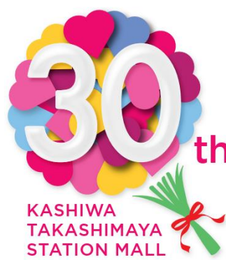
開業30周年記念ロゴ

JR常磐線と東武アーバンパークラインが交差する柏駅直結の本格的ショッピングセンター、柏高島屋ステーションモールは、人口150万人の商圏から年間2,400万人を集客し、地域のランドマークとして長年にわたり支持されております。