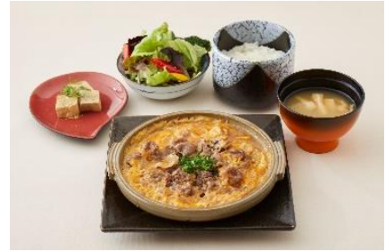
大田原牛超 柏店 (新館専門店 11F)