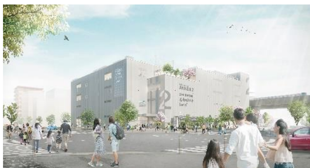
流山おおたかの森 S・C ANNEX2

昨年オープンした『流山おおたかの森 S・C FLAPS』、『NAGAREYAMA おおたかの森 GARDENS アゼリアテラス』に加え本年『流山おおたかの森 S・C ANNEX2』 『GREEN PATH』が開業することで、東神開発が手掛ける「流山おおたかの森駅」周辺エリアの4ヵ年におよぶ「森のタウンセンターとしての商業機能集積事業」は完成となります。本事業で創造した商業機能を核に、今後もまちづくり戦略に基づく面開発の拡大を図ります。6月30日（木）からは、今回開業する両施設の記念イベントを開催。お客様へ日頃の感謝を伝えると共に、引き続き街の魅力を一層高め、地域活性につなげてまいります。