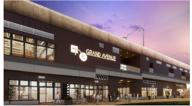
北側外観イメージ

流山おおたかの森駅直結の2階フードコートには、時間がない時にも便利な人気店に加え、「自家製生パスタ」や「台湾粥」の専門店など時間帯やその時の気分に合わせてご利用いただける店舗が加わります。また、2階にはギフトや手土産にぴったりのグラスデザートなどを揃えた南流山で人気のスイーツ店がオープン。そのほか、駅東口ロータリーに面した1階には、近隣にお住いの方がデイリーに使えるコンビニエンスストアや、お子さまと一緒に楽しめるお部屋をご用意したカラオケ店も登場します。